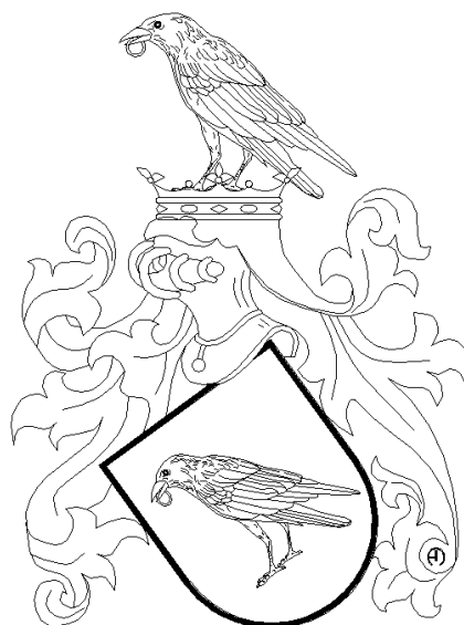
Otmar z Holohlav (Holohlavy, 2010)