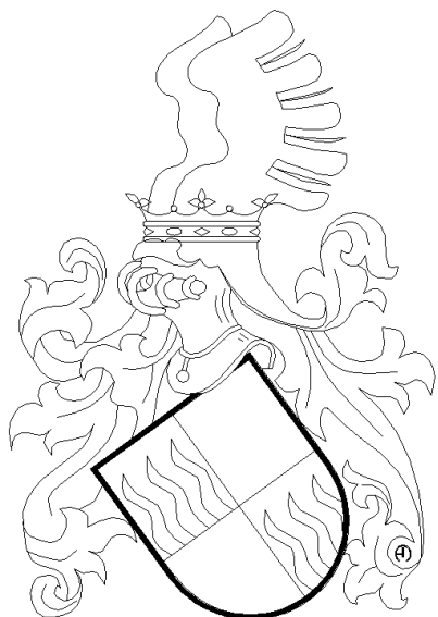
Horňatecký z Dobročovic (Dobročovice, 2009)

(Barevná vyobrazení naleznete na http://heraldika.drozd.info/hag/praha5.htm ).