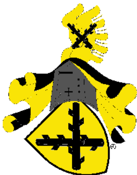
Čeněk z Klinštejna