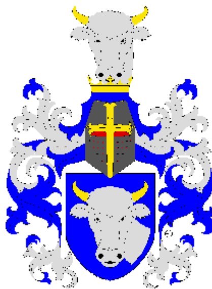
Zachař ze Všeradic a ze Svinař

(Jedná o pozdější podobu rodu z Hazmburka)