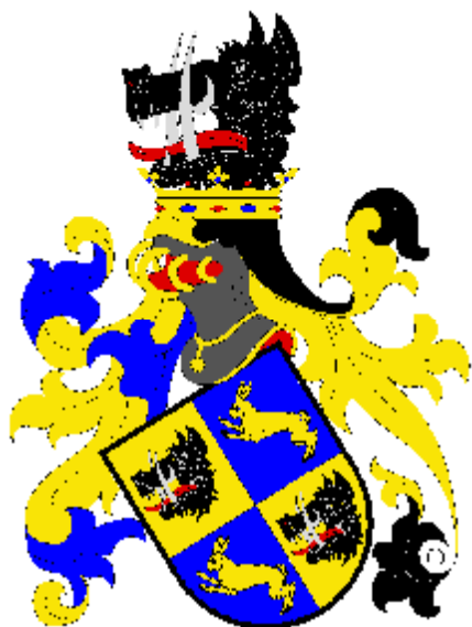
Oldřich Zajíc z Valdeka (Hazmburka)

(Barevná vyobrazení později naleznete na http://heraldika.drozd.info/hag/cesky-tesin.htm ).