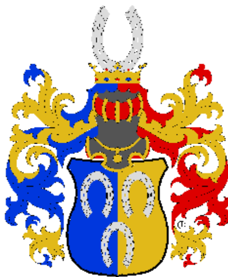
vladyka Kryštof Želenský ze Sebusína

Držitel tvrze Včelní Hrádek v Jílovém u Prahy - Kabátech na počátku 16.století.