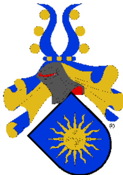
vladyka Václav Valečovský z Valečova

Držitelé tvrze Včelní Hrádek v Jílovém u Prahy - Kabátech ve 30. a 40.letech 15.století.