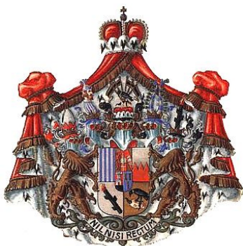
Knížecí rodina Schwarzenbergů (cca 5.500 zlatých)