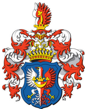
Hraběcí rodina Kolowrat-Krakovských (cca 4.000 zlatých)