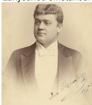
Jan Skramlík rytíř z Cronreuthu

* 1. července 1860, Praha + 6. září 1936, Praha