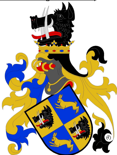
Zajíc z Hazmburka

Na jaře letošního roku jsem byl požádán, což pro mne bylo tradičně ctí, zda-li bych drobně nepřispěl heraldikou pro výstavu „Putování za předky“ České genealogické a heraldické společnosti v Praze, která se uskutečnila v Muzeu terezínské pevnosti od 5.května do 30.zář 2023. Nakreslil jsem čtyři erby držitelů sídel v okolí Terezína. (Vyobrazení později naleznete na www.heraldika.eu/hag/terezin.htm ).