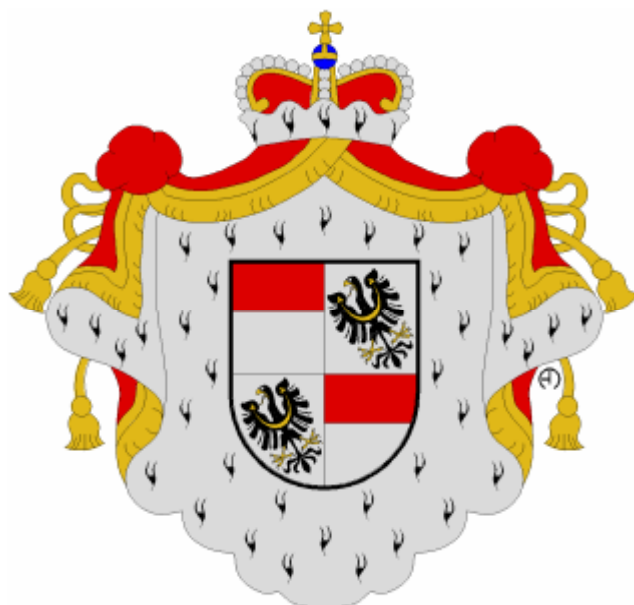
knížata z Lobkovicz