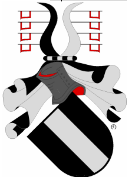
vladykové Kladenští z Kladna

Mým letošním prvním drobným příspěvkem jsem navázal na výstavu „Putování za předky“ České genealogické a heraldické společnosti v Praze, která se uskutečnila v Severočeské vědecké knihovně v Ústí nad Labem od 17.února do 12.března 2020. Letošní výstava proběhla v Depozitáři Knihovny Ústeckého kraje (nový název instituce) od 1.února do 30.dubna 2024. Drobně jsem graficky zaktualizoval původně vystavované čtyři erby držitelů hradu Střekov v Ústí nad Labem. (Vyobrazení později naleznete na http://heraldika.drozd.info/hag/unl-2024.htm ).