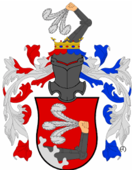
rytíři Selenderové z Prošovic