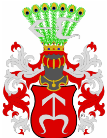
hrabata Sedlničtí z Choltic

Odkaz na erb rodu Piccolomini-Todeschini na přední straně sloupu se sochou Panny Marie Bolestné v městě Máchov u Police nad Metují.