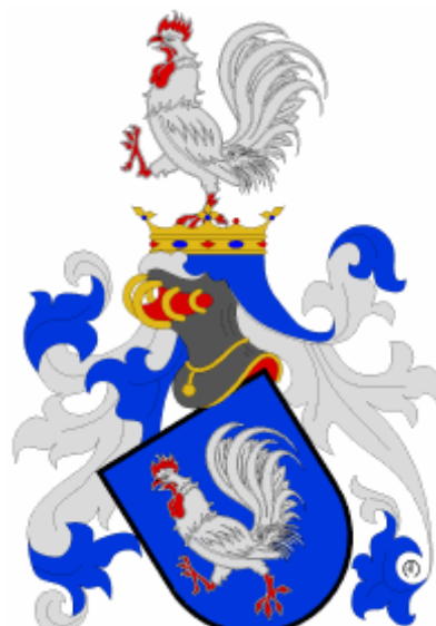
hrabata Strakové z Nedabylic

Odkaz na erb rodu Sedlnických z Choltic na východní stěně kostelní lodi kostela sv. Josefa Pěstouna ve městě Stárkov u Police nad Metují.